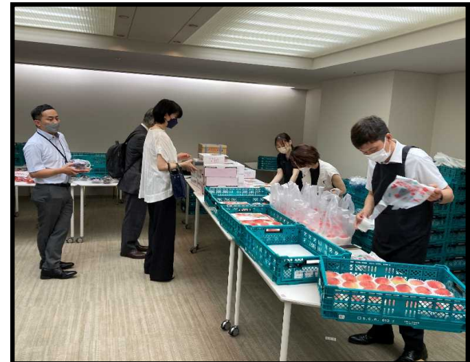
マルシェ開催状況