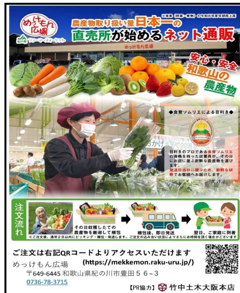
掲示しているPRポスター