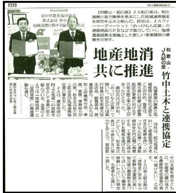
農業新聞記事（連携協定時）