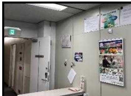
営業所受付掲示状況